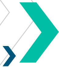
DIAGRAMA DEL MODELO DE SISTEMA